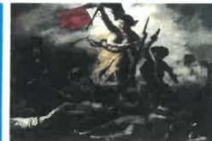
«E. Delacroix, La liberté guidant le peuple»